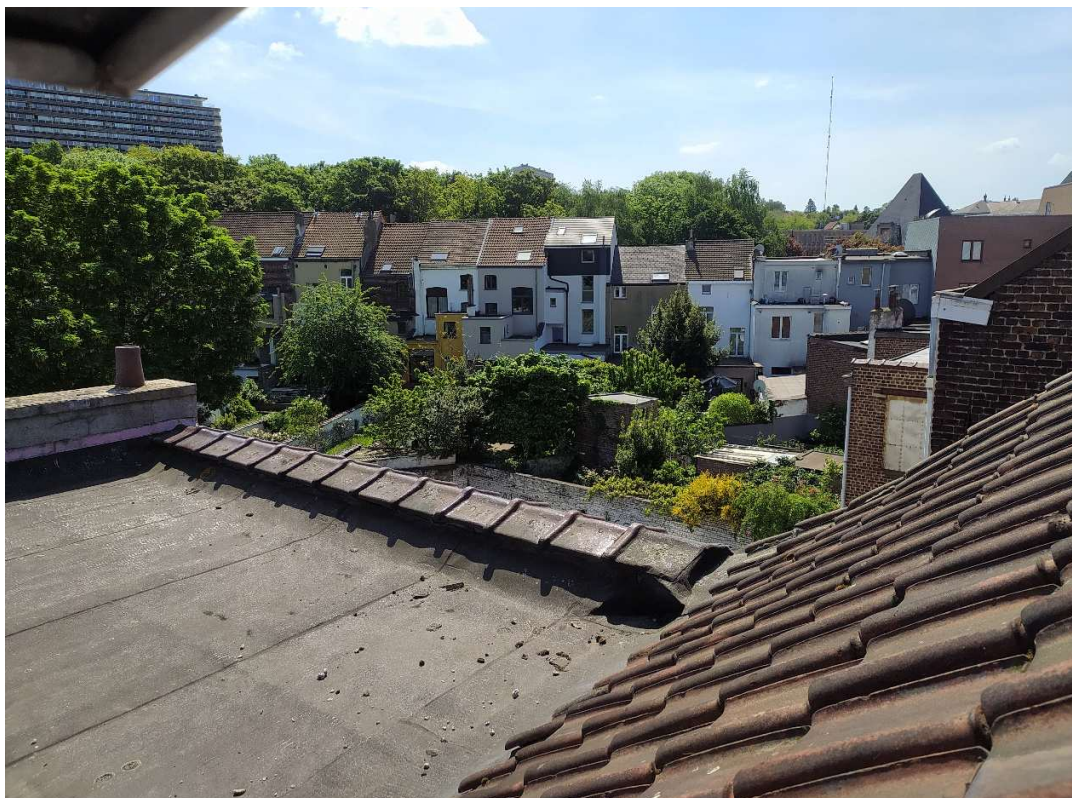
7- Intérieur d'îlot depuis le R+3 - vue Sud-Est