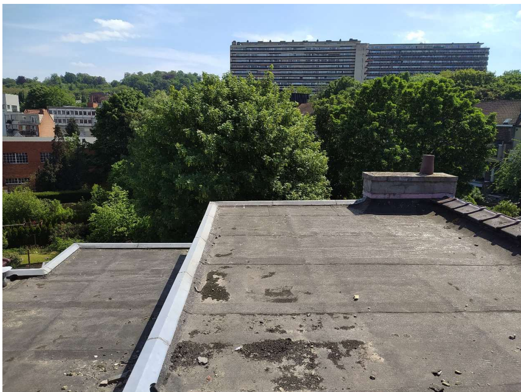
5- Vue de la plateforme destinée à terrasse