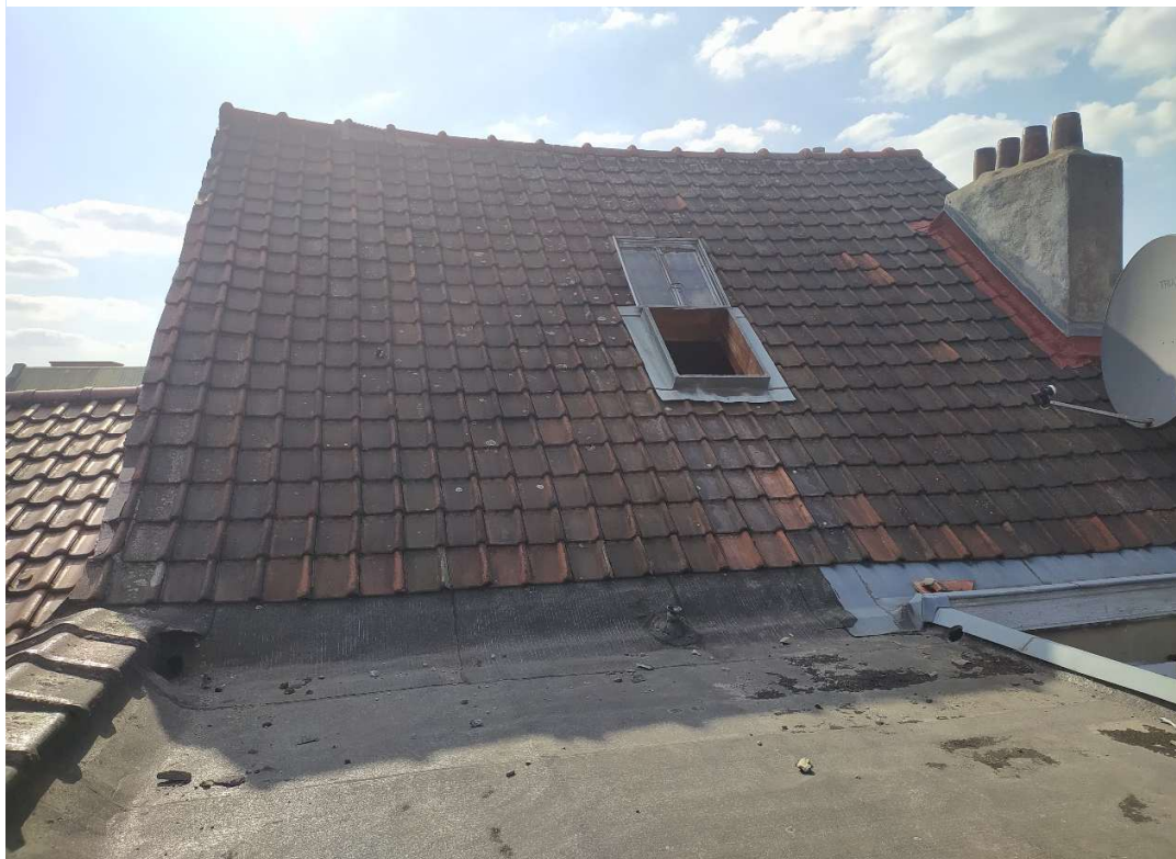
4- Vue de la lucarne projetée