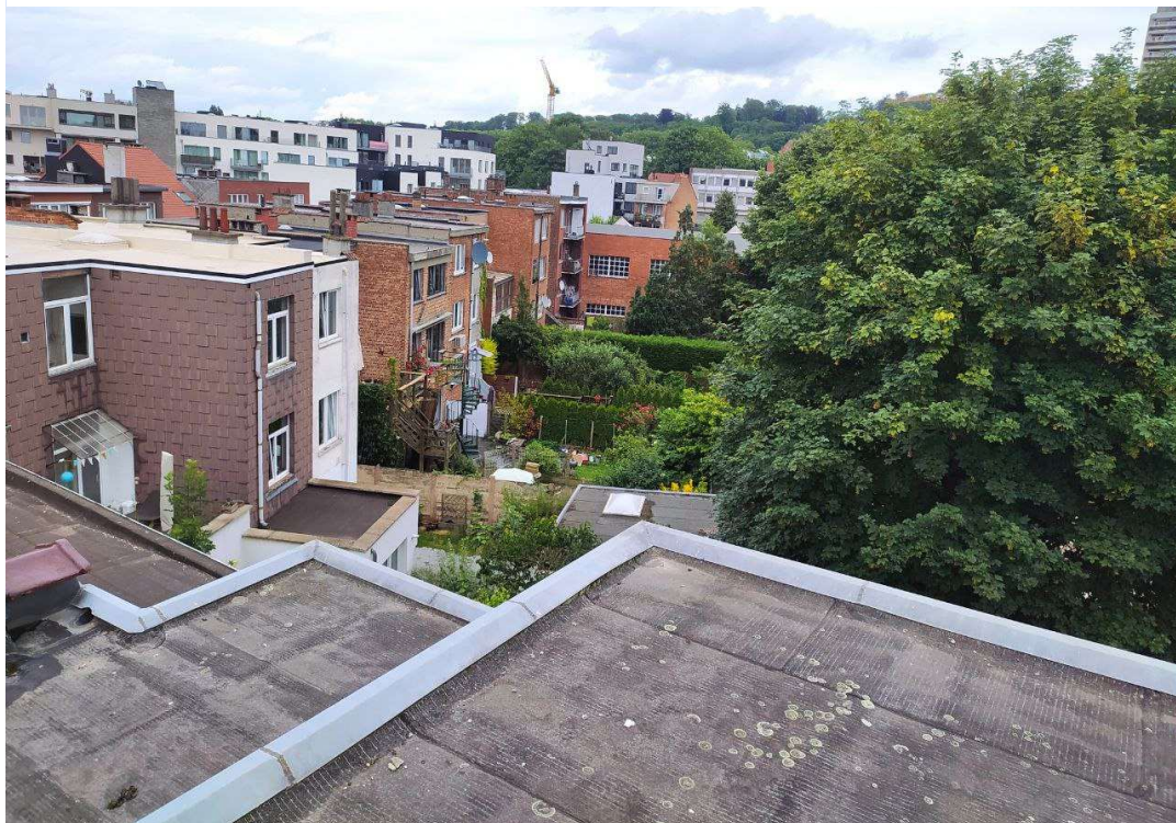
6- Intérieur d'îlot depuis le R+3 - vue Nord-Est