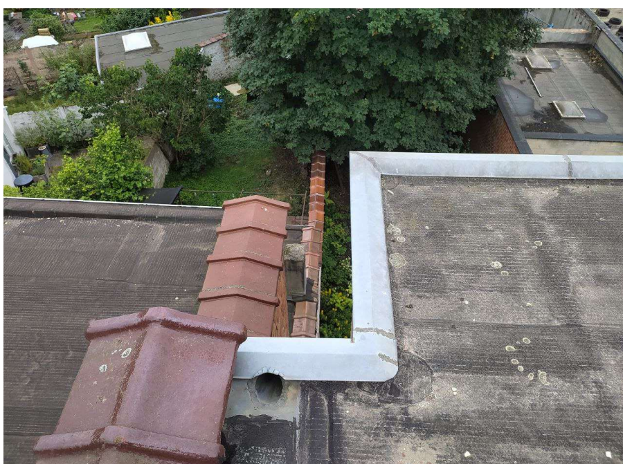
9- Vue du mur mitoyen depuis la toiture plate