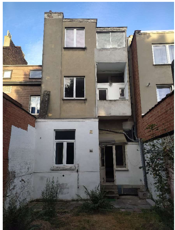
3- Vue façade arrière