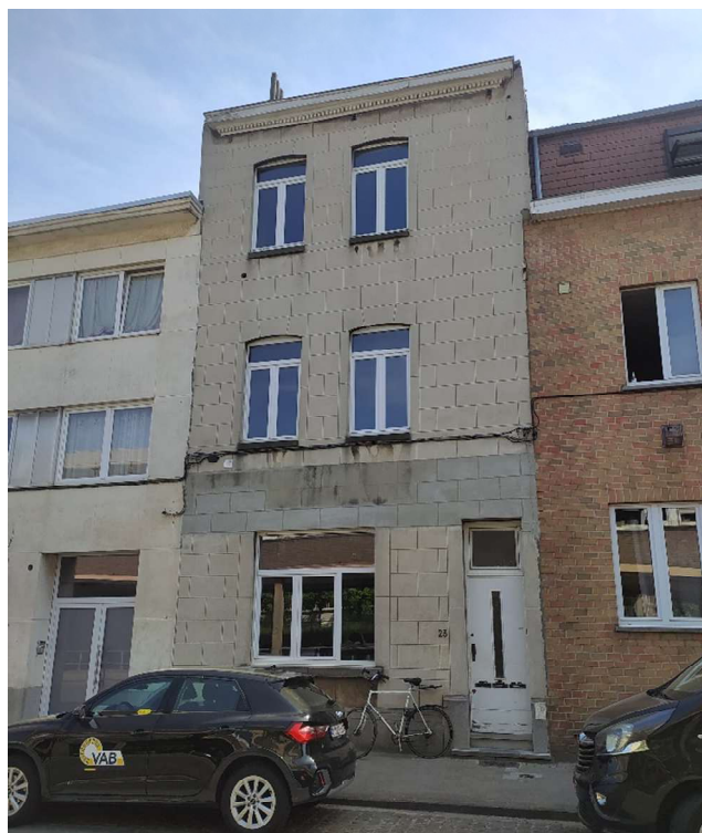
2- Vue façade sur rue