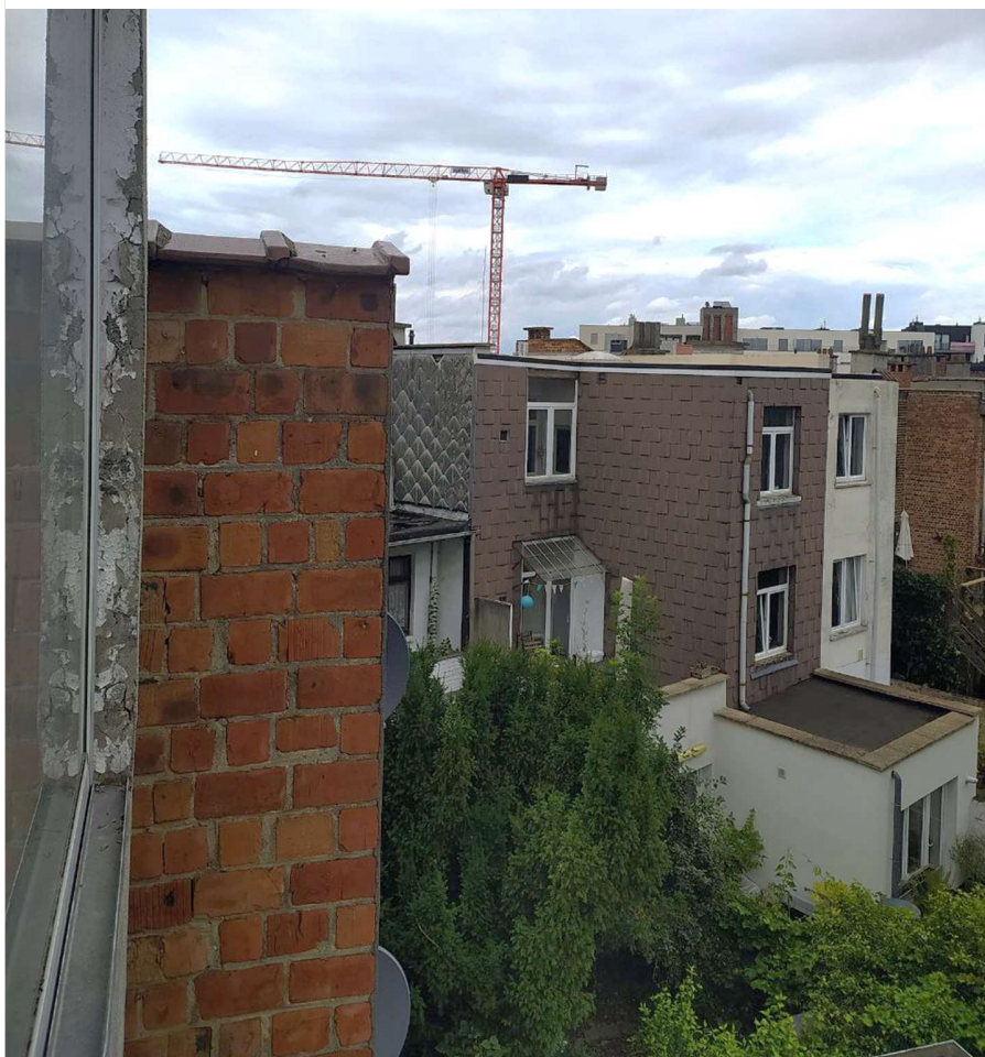
8- Vue depuis le balcon du mur mitoyen